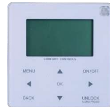
KJRM-120H/BMWKO-E (a bordo macchina)