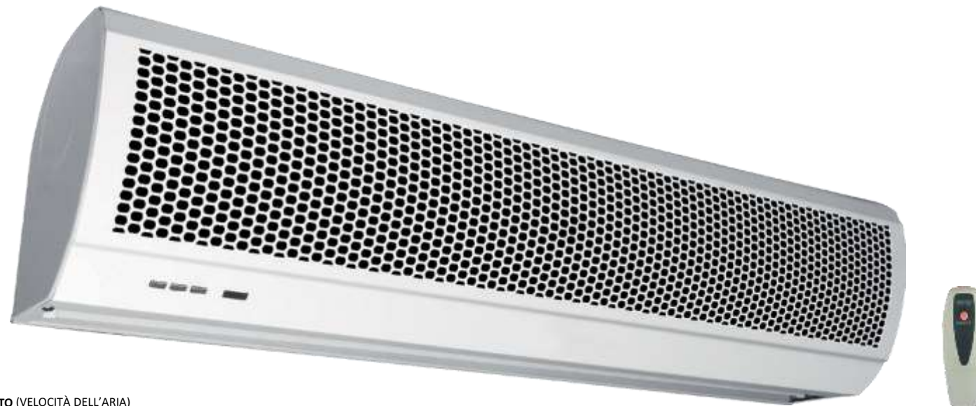
RENDIMENTO (VELOCITÀ DELL'ARIA) SERIE AC*-****SA1

Linea Industriale: Barriere a Lama d'Aria